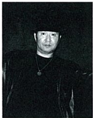
審査員 Yoshibow ストリートダンスを日本に広げたダンス界のバイオニア。

あづまや 055-948-0114 ・ いづみ荘 055-948-1235 ・ 糸びすや 055-948-1541 おおとり荘 055-948-1095 ・ 小松家八の坊 055-948-1301 ・ サンバレー富士見 055-947-3100 三楽の宿さかや 055-948-1255 ・ ホテル天坊 055-947-4489 ・ ニュー八景園 055-948-1500 はなぶさ 055-948-1230 ・ 姫の湯荘 055-948-1433