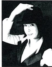
審査員 みすみ "Smilie" ゆきこ 日本を代表するタップダンサー。