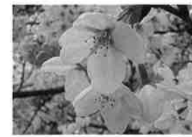
ソメイヨシノ (染井吉野) 【系統】エドヒガシ × オオシマザクラ 【花弁の色】淡いピンク 【花弁の大きさ】中輪一重 【開花期】4月上旬 【名前の由来】

江戸末期に江戸染井村(現・豊島区)の植木屋さんから「吉野桜」として売り出された品種であることから、日本を象徴する桜で北米や欧州にも広がっているようです。お花見といえば、このソメイヨシノです。