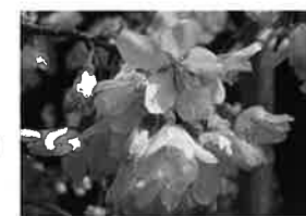
シダレザクラ (枝垂桜) 【系統】エドヒガシ 【花弁の色】白 【花弁の大きさ】小輪一重 【開花期】3月下旬 【名前の由来】

江戸末期に江戸染井村(現・豊島区)の植木屋さんから「吉野桜」として売り出された品種であることから、日本を象徴する桜で北米や欧州にも広がっているようです。お花見といえば、このソメイヨシノです。