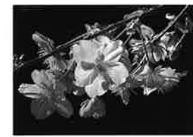
カワツザクラ (河津桜) 【系統】カンヒザクラ × オオシマザクラ 【花弁の色】淡いピンク 【花弁の大きさ】中輪一重 【開花期】3月中旬

にシダレザクラと呼んでいるようですが、シダレザクラという品種です。萼筒がくびれています。イトザクラとも呼ばれているようです。