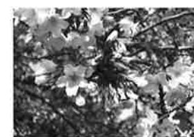
トモエザクラ (ともえ桜) 【系統】オオシマザクラとヤマザクラの自然交配種 【花弁の色】うすいピンク 【花弁の大きさ】中輪一重

伊豆半島河津町で発見された早咲きの桜で、新宿御苑には5本ある。淡いピンクで花弁の縁がやや濃いので全体が濃いピンクに見える。花弁の先端に切れ込みがある。